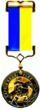
"Харків'янин року" - 2004