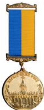
"Харків'янин року" - 2010