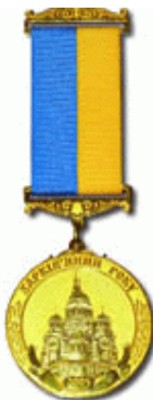
"Харків'янин року" - 2005