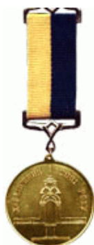
"Харків'янин року" - 2001