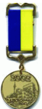
"Харків'янин року" - 2002