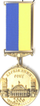
Харків'янин року" - 2006