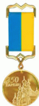
"Харків'янин року" - 2003