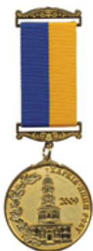
"Харків'янин року" - 2009