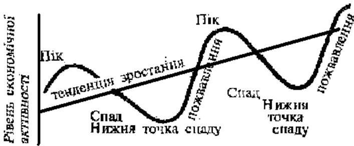
Рис. 1. Економічний цикл

Відомо, що К. Маркс називав такі фази як: криза, депресія, поживлення і піднесення, а під економічним циклом розумів рух виробництва від однієї кризи до початку іншої. На рис. 1 відображено ідеалізований економічний цикл. Розгляд починається з піку циклу, коли в економіці спостерігається повна зайнятість і виробництво працює на повну або майже повну потужність. У цій фазі циклу рівень цін має тенденцію до підвищення, а зростання ділової активності припиняється.