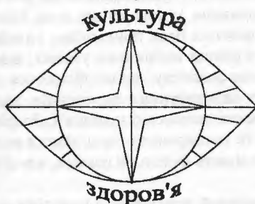
Рис. 1. Символ культури здоров'я

Зображення символу культури здоров'я складається з: чотирикутної зірки, кола, еліпса, відрізка, напису. Композиція має такий вигляд: у центрі знаходиться чотирикутна зірка (червоного кольору), всередині якої міститься хрест, кути зірки поєднані дугами, котрі створюють коло (жовтого кольору), ці фігури знаходяться всередині еліпса (блакитного кольору), коло й еліпс поєднані між собою відрізками різної довжини, навколо еліпса символом напис: зверху «КУЛЬТУРА», знизу «ЗДОРОВ'Я» (рис. 1).