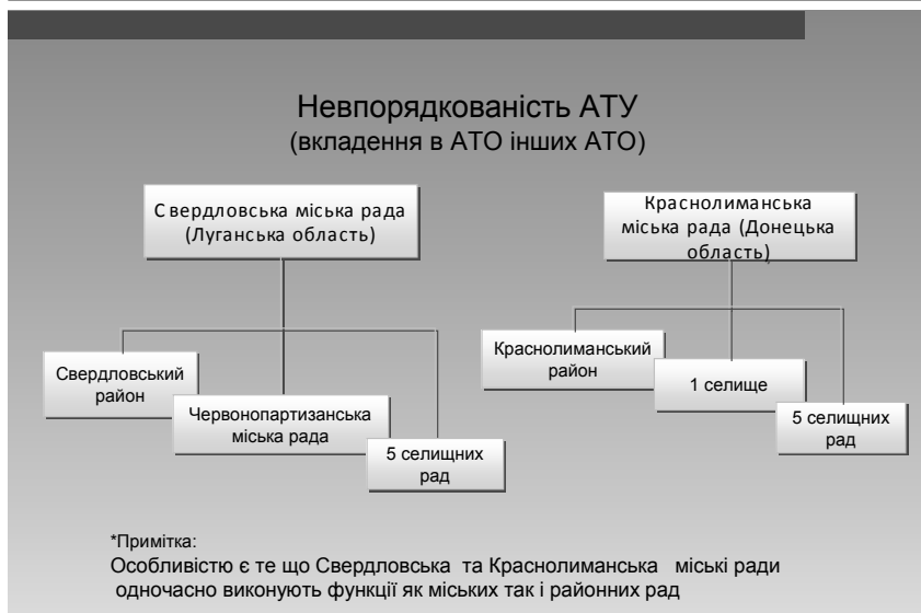
Мал. 2. Приклад «вкладення» одних АТО в інші АТО

Класичними вимогами до системи АТО є їх ієрархія за рівнями АТУ та безперервність юрисдикції. В Україні ж, на жаль, має місце багато прикладів, коли така ієрархія не дотримується. Хрестоматійними прикладами тут є міста Севастополь та Ялта, які складаються кожне із 31 поселення. Причому в межах міст наявні значні масиви сільськогосподарських земель, заповідники, дачні поселення. Наявність у складі міста інших міст чи селищ, які мають свої органи місцевого самоврядування з такою ж компетенцією, що й міські органи, значно ускладнює питання розпорядження землею, встановлення системи місцевих податків, визначення оптимальної мережі бюджетних установ та формування бюджетів «великого» міста і міст чи селищ, що входять до його складу.