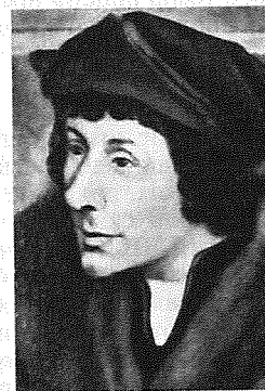
Еразм Роттердамський. Портрет роботи художника Г.Гольбейна Молодшого. 1523.

ЕРГА ОМНЕС (лат. erga omnes — такий, що розповсюджується на всіх) — у сучас. міжнародному праві кваліфікація загальних, таких, які поширюються на всі д-ви, обов'язків. Між власне д-вою і міжнар. співтовариством як сукупністю держав складаються відносини, які ґрунтуються на нормах заг. права і на необхідності захисту фундам. інтересів цього співтовариства. Наявність заг. обов'язків держав у зв'язку із спільними інтересами співтовариства не раз констатували Міжнародний суд ООН , який кваліфікував їх як обов'язки (навіть позадоговірні) перед співтовариством у цілому. Порухення обов'язків Е. о. розглядається співтовариством як міжнар. злочин. Ідеться про обов'язки, які