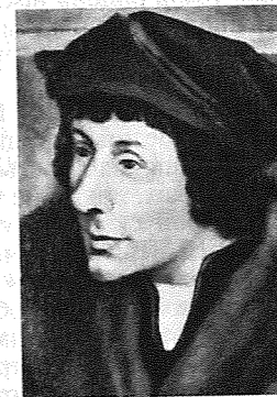
Еразм Роттердамський. Портрет роботи художника Г. Гольбейна Молодшого. 1523.

ЕРАЗМ РОТТЕРДАМСЬКИЙ (Erasmus von Rotterdamus), Дезидерій [Desiderius; справж. — Герхард Герхардс; 28.X 1466 (за ін. даними — 1465, 1467, 1469), Роттердам — 12.VII 1536, Базель] — нідерл. теолог, філолог і письменник, доктор теології з 1506. У 1495—99 вивчав теологію у Париз. ун-ті. Крім Нідерландів, жив у Франції, Англії, Італії; з 1513 — переважно у Швейцарії (Базель). Осн. праці — сусп.-політ. і державно-правового спрямування: «Похвала Глупоті» (1509), «Виховання християнського володаря» (1516), «Скарга Миру, звідусіль гнаного і повсюдно топтаного» (1517), «Домашні бесіди» (1518), «Про свободу волі» (1524). Вчення Е. Р. про д-ву і право можна назвати «антропологічним», оскільки в його основі — христ. гуманізм, найвищою цінністю якого є гідність людини як основа соціального і державного життя. Людина в Е. Р. постає як «особа божественна», що природою і законом наділена свободою волі. Відтак д-ва є механізмом реалізації спільної волі ін-