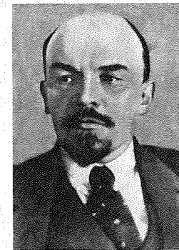
В. І. Ленін.

Повернувшись до Росії у квітні 1917, висунув курс на соц. революцію. Від липня по листопад 1917 — на нелег. становищі. Вів орг. роботу, спрямовану на повалення існуючого в Росії держ. ладу. Очолив жовт. збройне повстання у Петрограді. На 2-му Всерос. з'їзді Рад [25—26.X (7—8.XI) 1917] обраний головою Ради Нар. Комісарів (РНК), Ради роб. і сел. оборони.