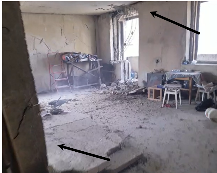
Рис. 2. Загальний вигляд цієї ж квартири після другого влучання 122 мм реактивного снаряду, який пробив міжповерхові плити (стрілками позначені вхідний (на стелі) та вихідний (на підлозі) отвори пошкоджень)

Враховуючи види осколків та фрагментів елементів конструкції боєприпасів, які були вилучені власником квартири під час її прибирання, було встановлено, що у першому випадку в квартиру влучив 122 мм реактивний снаряд «9М22У» з осколково-фугасною головною частиною «9Н51», а у другому випадку – 122 мм реактивний снаряд «9Ф28Ф-1» з осколково-фугасною головною частиною «9Н55».