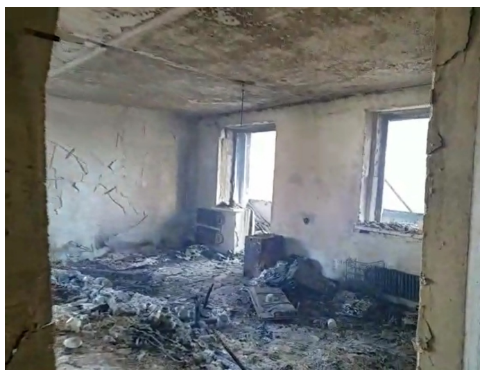
Рис. 1. Загальний вигляд квартири після першого влучання 122 мм реактивного снаряду через вікно

У березні 2022 р. в означену квартиру влучив перший 122 мм реактивний снаряд з осколково-фугасною головною частиною до реактивної системи залпового вогню типу «Град» (рис. 1), а через місяць, у квітні, в цю ж саму квартиру влучив другий 122 мм реактивний снаряд з осколково-фугасною головною частиною (рис. 2).