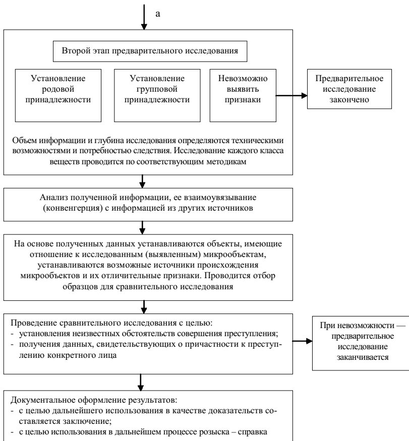
Рис. 2. Окончание