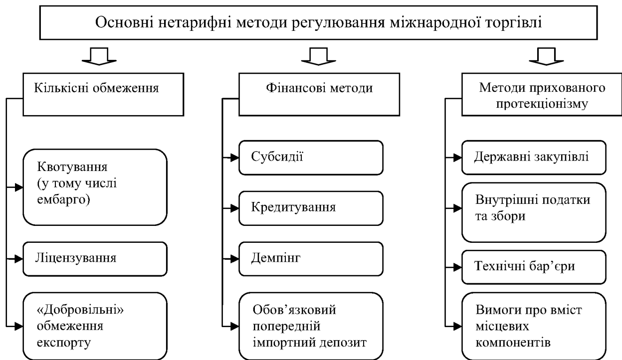
Рис. 4.1. Основні нетарифні методи регулювання міжнародної торгівлі

Квотування – кількісне обмеження обсягу експорту/імпорту певного товару. Квота – максимально дозволений протягом певного